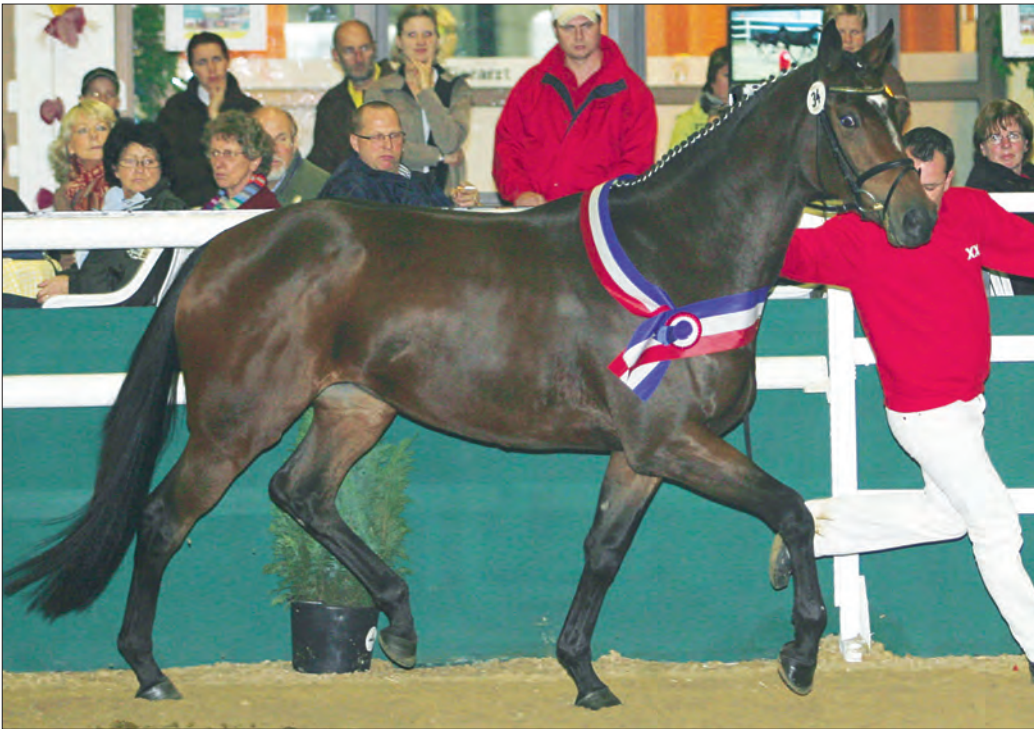
Vollblutpferde besitzen gegenüber Warmblutpferden einen höheren Energie-Erhaltungsbedarf.

Die umsetzbare Energie kann zur Beurteilung des Erhaltungsbedarfs verwendet werden (von Dr. Ernst Stephan SALVANA TIERNÄHRUNG Elmshorn)