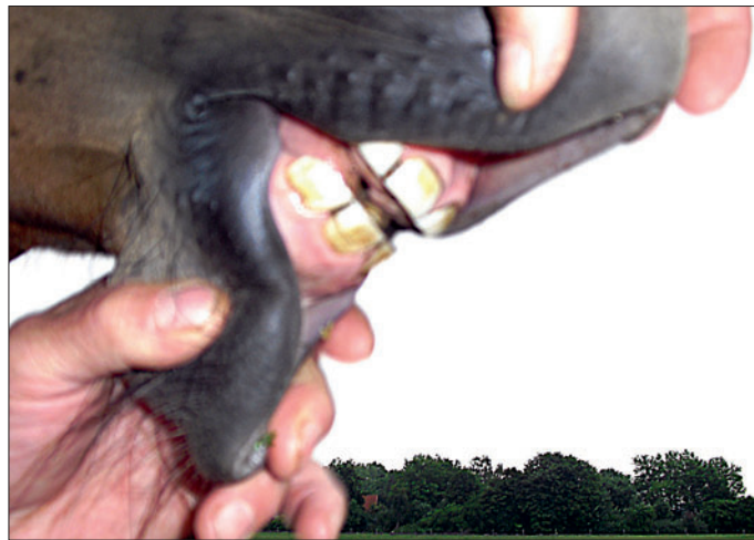
Schneidezähne des Fohlens (geb. am 7. März 2010) einer Corrado-Stute.

Nach den Schneidezähnen folgt in Richtung Backenzähne eine zahnfreie Lücke im Kiefer, die als sogenannte Lade bezeichnet wird. Dort liegt die Trenne.